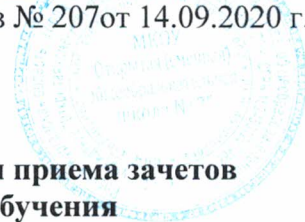
График проведения индивидуальных консультаций и приема зачетов для учащихся очно-заочной формы обучения и имеющих академическую задолженность по предметам на 2020 – 2021 учебного года